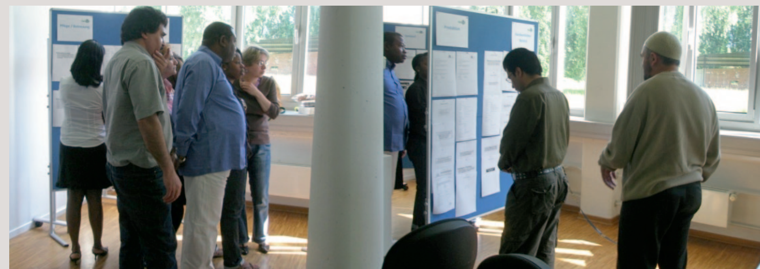
Teilnehmende des Projekts Horizont bei der Stellenrecherche

Die Begleitung der TeilnehmerInnen endet in der Regel nicht mit der Arbeitsaufnahme. Auch während der Beschäftigung wird der bestehende Kontakt zu den MitarbeiterInnen des Projektes gepflegt. Bei Fragen oder Problemen während der Beschäftigung stehen AnsprechpartnerInnen zur Verfügung. Schwierigkeiten können auf diese Weise mitunter schnell geklärt werden.